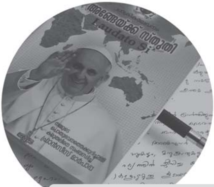
അങ്ങേയ്ക്ക് സ്തുതി - 4