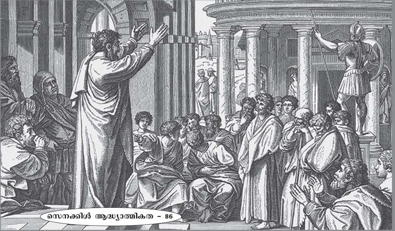
സെനക്കിൾ ആദ്ധ്യാത്മികത - 86