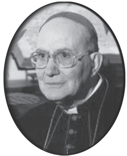
ബിഷപ്പ് വില്യം ജകീന്താ