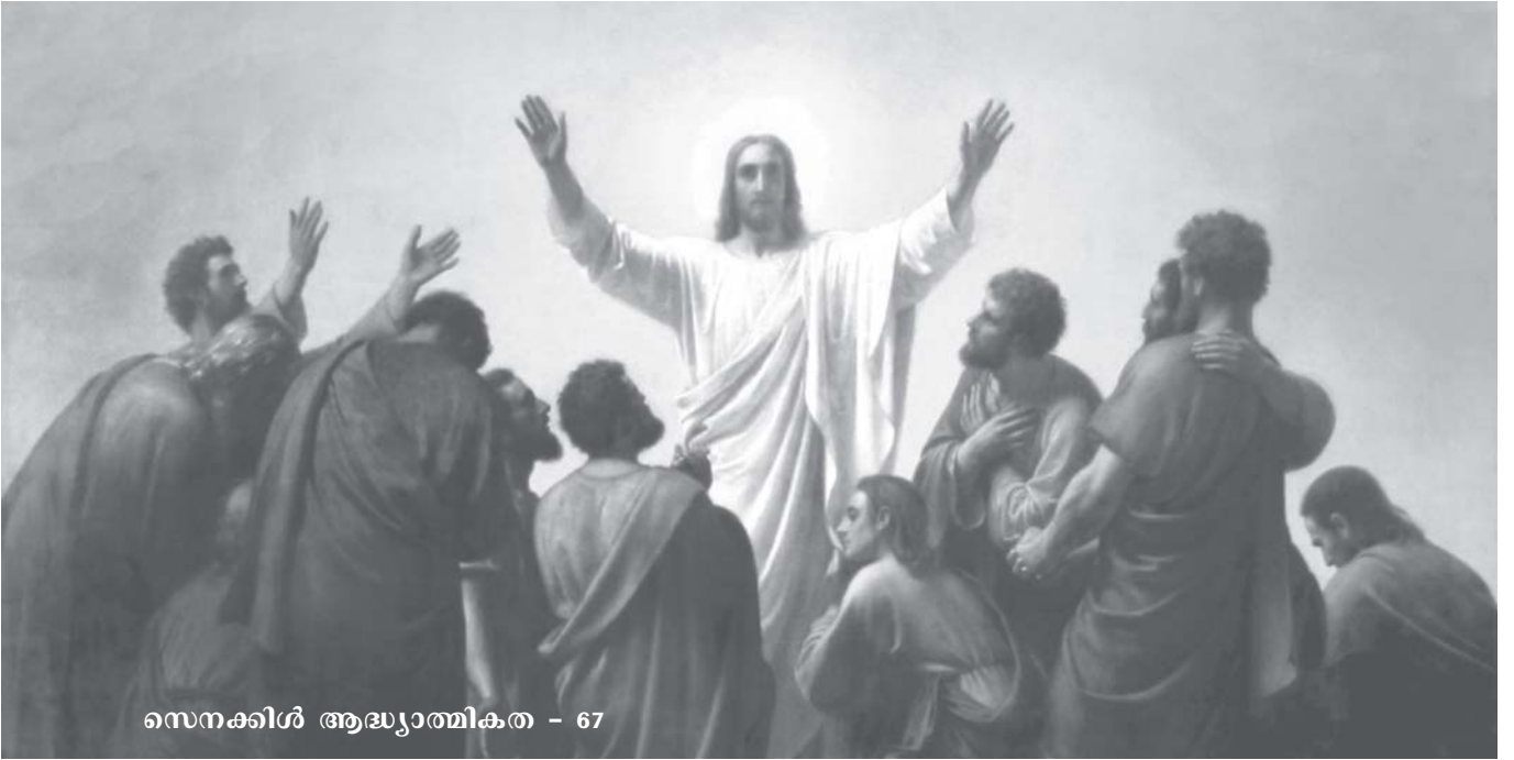
സെനക്കിൾ ആദ്ധ്യാത്മികത - 67