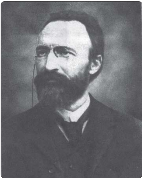
വാഴ്ത്തപ്പെട്ട ബർത്തലോ ലോംഗോ

സാന്താന്റെ ആരാധനയ്ക്കടിമയായി ക്കഴിഞ്ഞിരുന്നു എന്റെ ജീവിതം!! ആരോഗ്യം നഷ്ടപ്പെട്ടു. ഞാനൊരു വിഷാദരോഗിയായി!! സാന്താന്റെ അടിമയായിക്കഴിയുമ്പോൾ നഷ്ടപ്പെടുന്നത് ആത്മീയ സന്തോഷമാ ണല്ലോ?. ഉത്കണ്ഠയും ഭയവും എന്നെ വേട്ട യാടി, വേവലാതികൾക്കു നടുവിൽ ഞാൻ