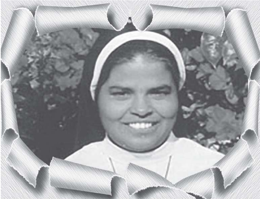
ജിജി പുല്ലത്തിൽ അപ്പസ്തോലിക് ഒബ്ലേറ്റ്സ്