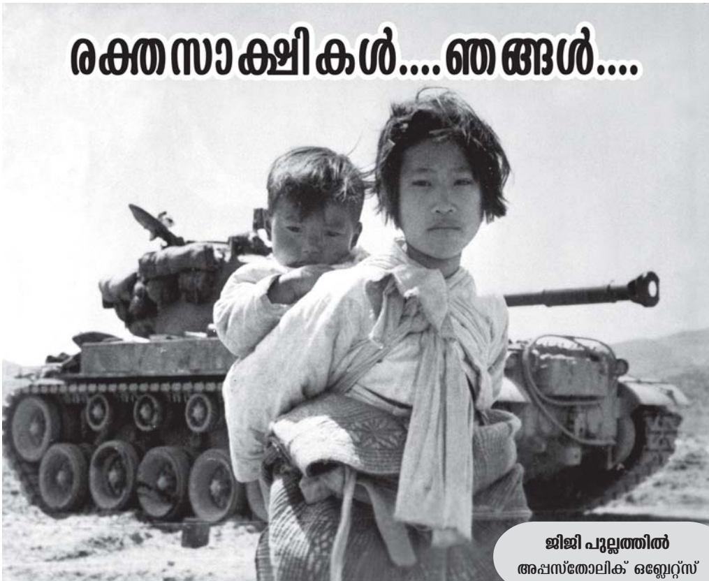
ജിജി പുല്ലത്തിൽ അപ്പസ്തോലിക് ഒബ്സെർവ്വേഴ്സ്