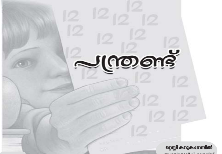
ഒറ്റപ്പി കറുകപ്പറമ്പിൽ അപ്പസ്തോലിക് ബ്ലോഗ്സ്

വ്യാപകർത്ഥത്തിൽ ഈ വാക്യത്തിന് മറ്റൊരു സൂചനകൂടിയുണ്ട്. പ്രവർത്തനരഹിത്യത്തിൽനിന്നുളവാകുന്ന സമാധാനം ഈശോ ആഗ്രഹിക്കുന്നില്ല. ലോകത്തിലെ അനീതിയോടും അക്രമത്തോടും മറ്റ് തിന്മയുടെ ശക്തിയോടും ഏറ്റുമുട്ടി അവയെ ഇല്ലാതാക്കുമ്പോൾ അനുഭവപ്പെടുന്ന സമാധാനമാണ് യഥാർത്ഥമായത്. നിഷ്ക്രിയതയിലൂടെ കൈവരിക്കുന്ന ‘സമാധാനം’ അനീതിയെ ശാശ്വതീകരിക്കുന്ന ഒന്നായിരിക്കും. ഈശോ വിഭാവനം ചെയ്യുന്ന സമാധാനം സംസ്ഥാപിക്കുവാൻ അനീതിയ്ക്കെതിരായി വാൾ എടുക്കേണ്ടിവരും. അപ്പോൾ അസ്വസ്ഥതകൾ അനുഭവപ്പെടുക സാധാവികമാണ്. അവയെ നേരിടാൻ മിശിഹായുടെ ശിഷ്യർക്കു കഴിയണം.