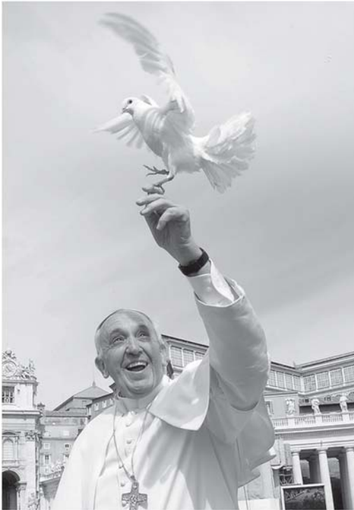
മംഗലപാർക്കൽ - ഫിറവ്വി ലക്കം 2014

സാത്താന്റെ പിടിയിലായ അനുഭവവും ഉണ്ട്. “നിങ്ങൾ എനിക്കു തിന്മ ചെയ്തു. പക്ഷേ ദൈവം അതു നന്മയായി മാറ്റി” (ഉൽപ 50:20) എന്ന പുർവ്വപിതാവായ യൗസേപ്പിന്റെ വാക്കുകൾ ഇന്നും അമ്പർത്ഥമാകുന്നു.