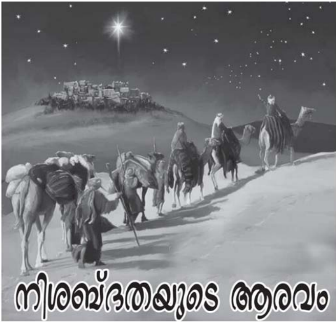
ജീസ കൂട്ടിയാനിക്കൽ അപ്പസ്തോലിക് ഒബ്ലേറ്റ്സ്

ആ പനിനീർപുഷ്പം വളരെ മനോഹരമായി കാണപ്പെട്ടു. പ്രഭാതക്ഷണത്തിനുശേഷം മുറ്റത്തേക്കിറങ്ങിയപ്പോൾ കണ്ട മനോഹര കാഴ്ച ഇളം റോസ് നിറവും ആരെയും മനം കൂളിർപ്പിക്കുന്ന സൗന്ദര്യവും... ആ കൊച്ചു പൂവ് നിശബ്ദമായി എന്തൊക്കെയോ വിളിച്ചുപറയുന്നതുപോലെ... വൈകുന്നേരവും റോസാപ്പൂവിനെ കാണാനുള്ള ആകാംക്ഷയോടെ ഞാൻ മുറ്റത്തേക്കിറങ്ങിയപ്പോൾ കണ്ട കാഴ്ച ഹൃദയഭേദകമായിരുന്നു. ഒരൊറ്റ ഇതൾപോലും അവശേഷിക്കാതെ എല്ലാം തറപറ്റിയിരിക്കുന്നു. നിരാശയോടെ നിന്ന എനോട് വീണ്ടും ആ ഇതളു